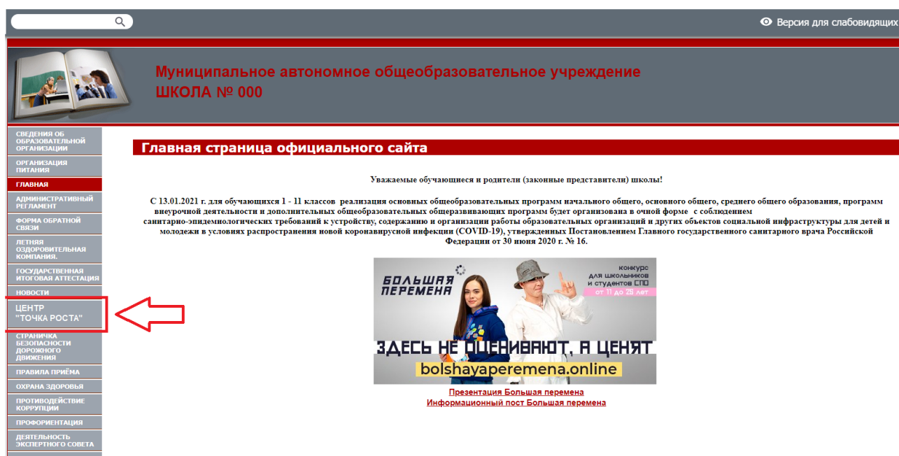
Рисунок 2. Пример размещения ссылки на раздел на сайте общеобразовательной организации

На официальном сайте общеобразовательной организации, в которой создается центр образования естественно-научной и технологической направленностей «Точка роста» (далее – центр «Точка роста», центр) в рамках федерального проекта «Современная школа» национального проекта «Образование», не позднее даты начала функционирования центра (не позднее 1 сентября года создания центра) создается раздел «Центр «Точка роста». Ссылка на раздел размещается в главном меню сайта общеобразовательной организации и должна быть видима при просмотре каждой страницы. Ссылка не может являться вложенной в другие меню. Пример размещения ссылки на раздел «Центр «Точка роста» в меню официального сайта общеобразовательной организации в сети «Интернет» приведен на рисунке 2.